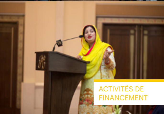
ACTIVITÉS DE FINANCEMENT