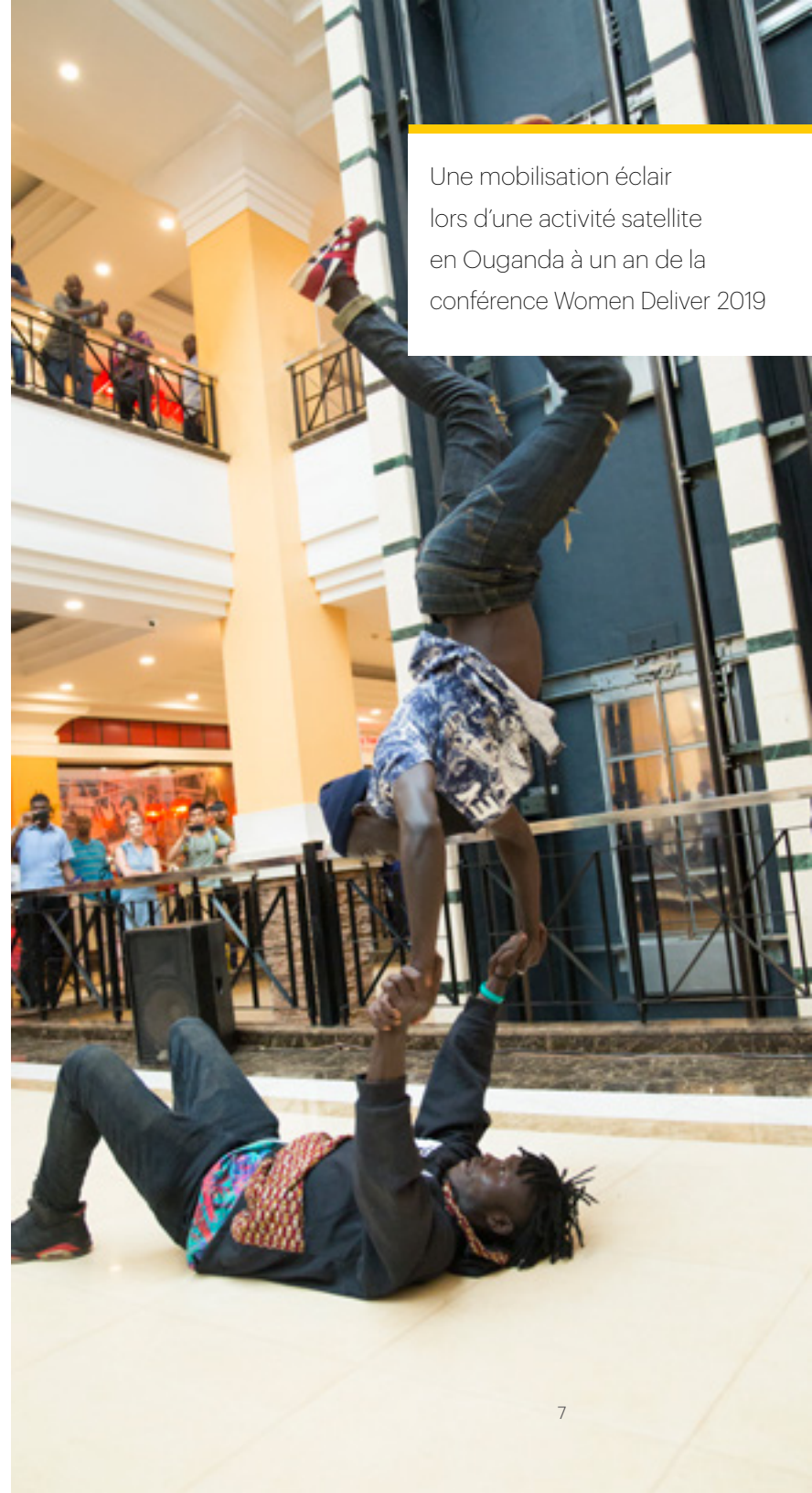
Une mobilisation éclair lors d'une activité satellite en Ouganda à un an de la conférence Women Deliver 2019