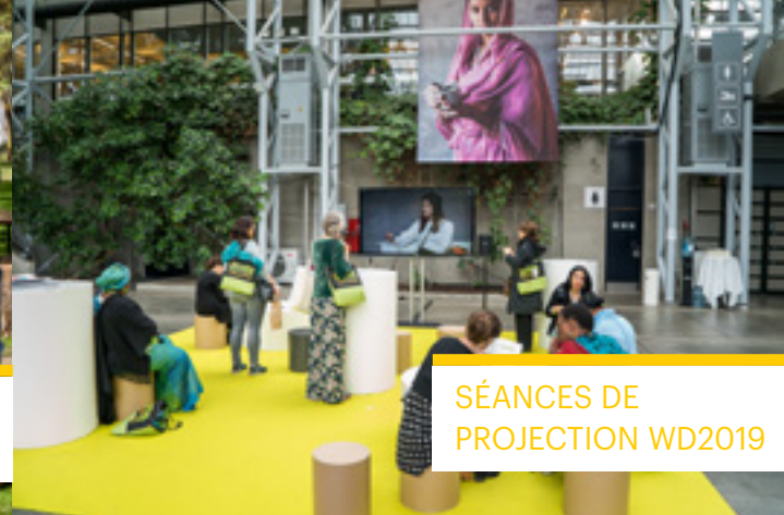
SÉANCES DE PROJECTION WD2019