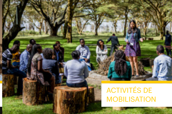
ACTIVITÉS DE MOBILISATION