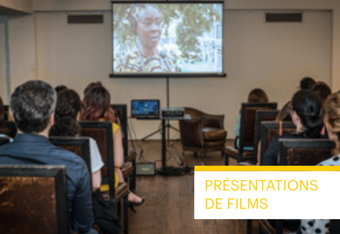
PRÉSENTATIONS DE FILMS